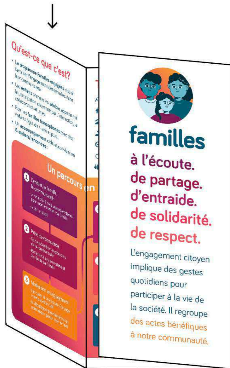
La couverture avant se trouve derrière ce panneau